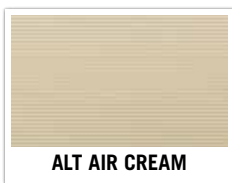
ALT AIR CREAM

Fibercon AP: 4.0 / 5.38 / 6.38 / 7.38 / 8.38 9.38 / 10.38 / 12.38 / 15.38