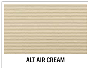
ALT AIR CREAM

Fibercon AP: 4.0 / 5.38 / 6.38 / 7.38 / 8.38 / 9.38 / 10.38 / 12.38 / 15.38