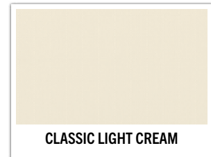
CLASSIC LIGHT CREAM