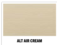
ALT AIR CREAM

FIBERCON AP: 4.0 / 5.38 / 6.38 / 7.38 / 8.38 / 9.38 / 10.38 / 12.38 / 15.38