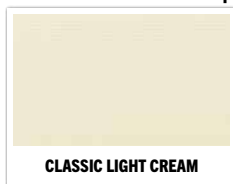
CLASSIC LIGHT CREAM

FIBERCON LOW ASPECT: 6.46 / 7.46 / 8.46 / 9.46 / 10.46